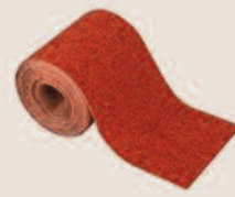
la carta vetrata