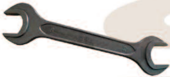
la chiave inglese