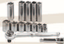
le chiavi a bussola