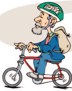
andare in bici ride